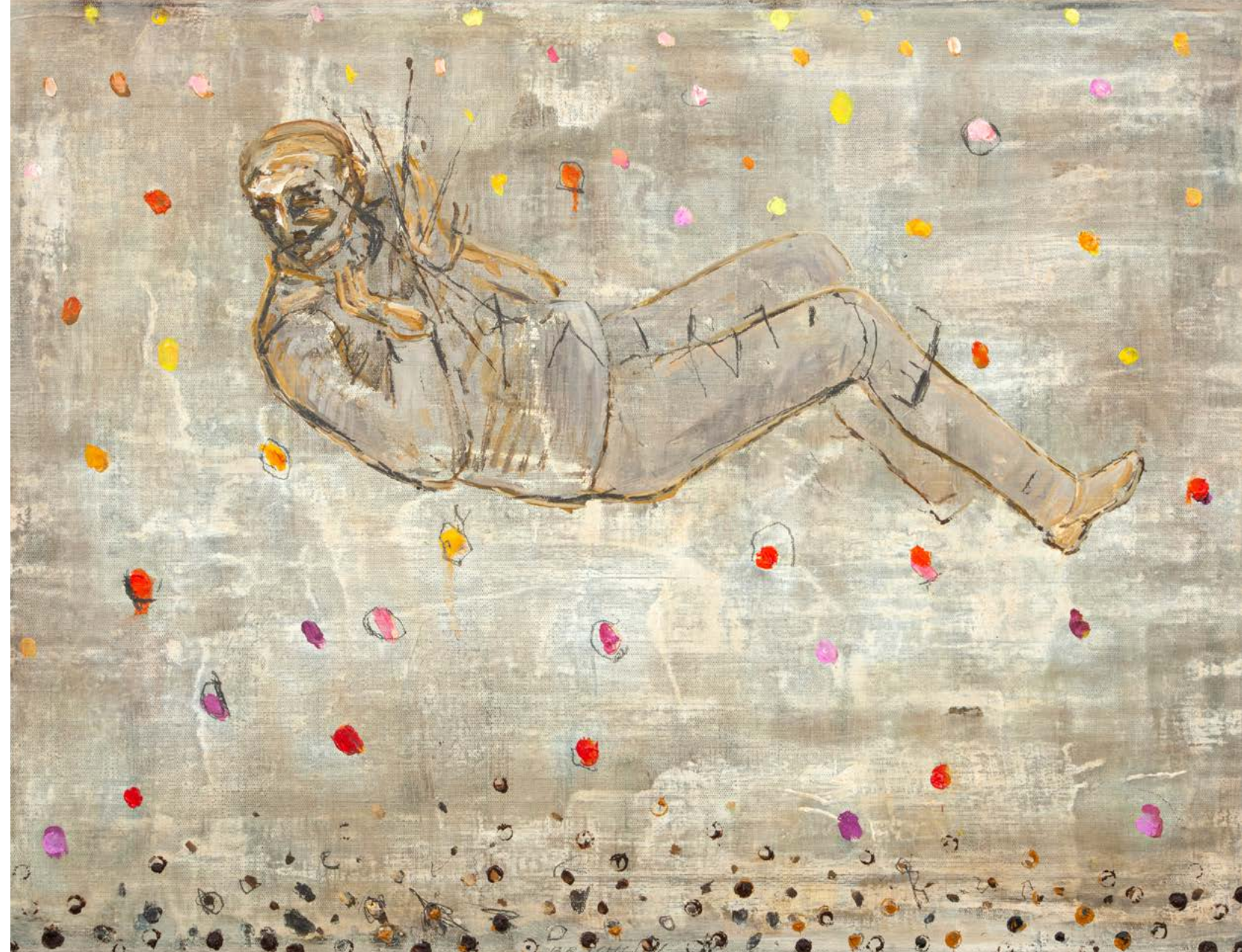
SEDMÉ NEBE / 2014 olej/plátno, 50 x 65 cm