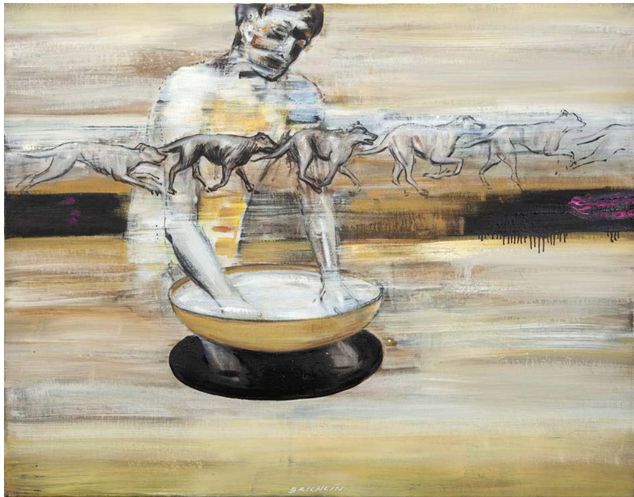
ŽIVOTABĚH / 2023 olej/plátno, 110 x 140 cm