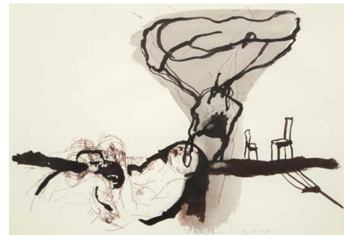
4x BEZ NÁZVU / perokresba, akvarel/papír, 29 x 42 cm