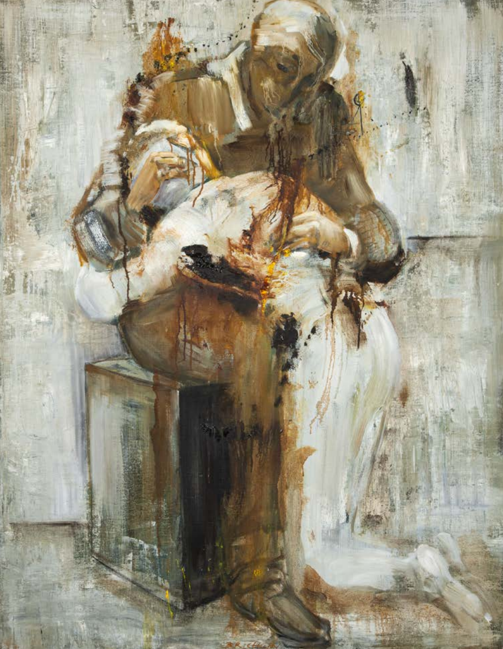
NÁVRAT MARNOTRATNÉHO SYNA / 2022 olej/plátno, 130 x 100 cm