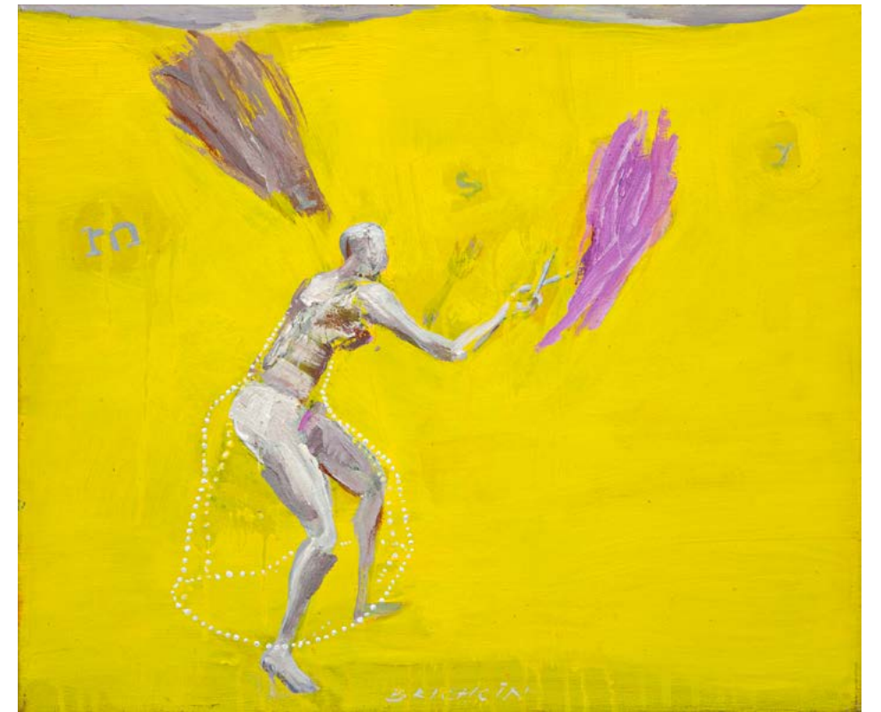
MISTY / 2022-24 olej/plátno, 35 x 40 cm