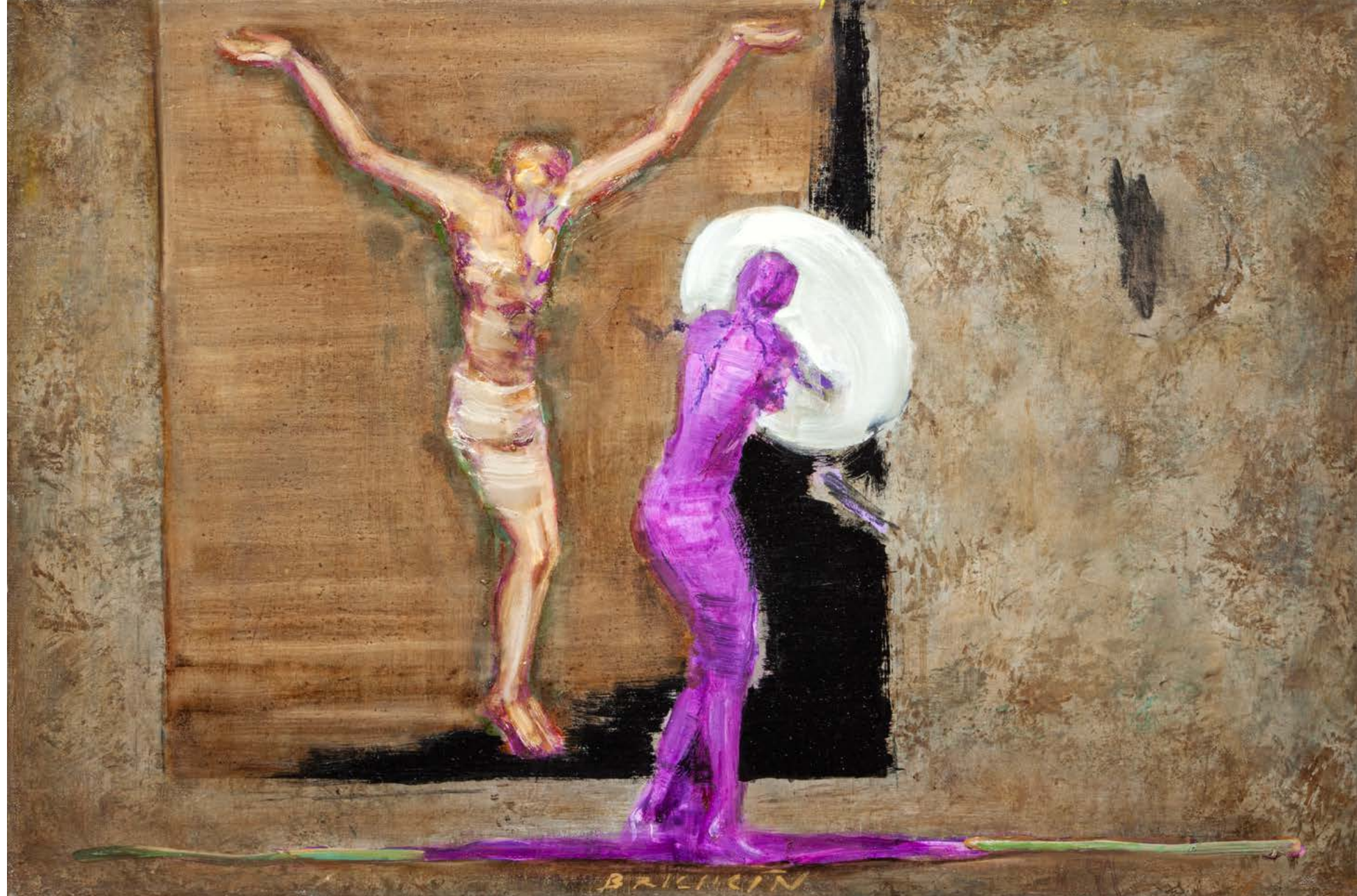
PUNTA DELLA DOGANA II (OKAMŽIK) / 2023 ▶ olej/plátno, 45 x 65 cm