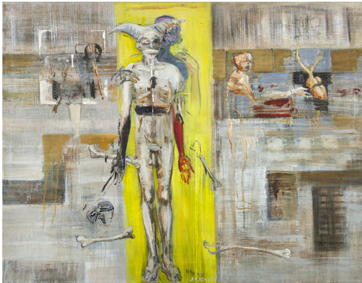
TANEC KOSTÍ / 2023 olej/plátno, 110 x 140 cm