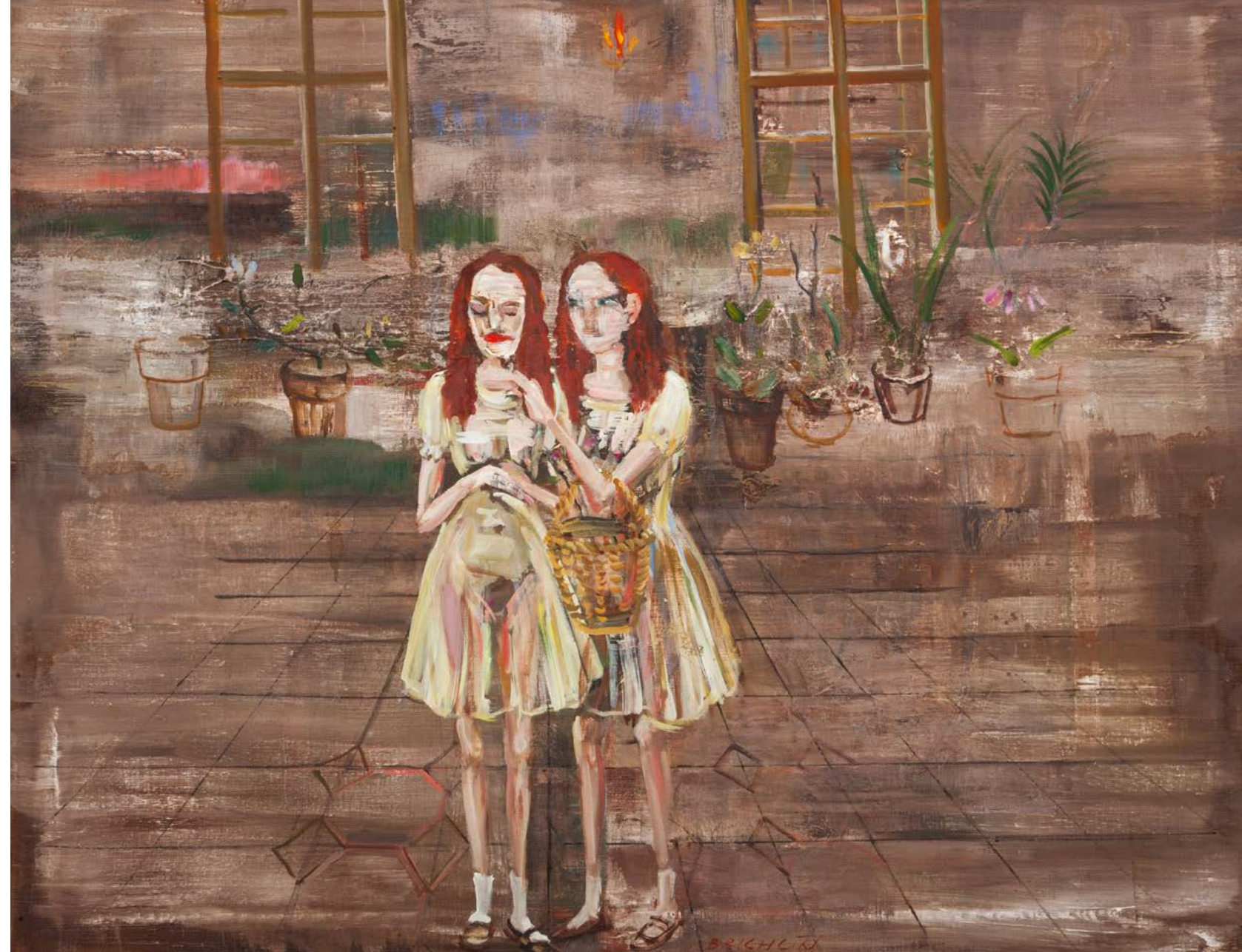
DVOJČATA / 2020 ▶ olej/plátno, 85 x 105 cm