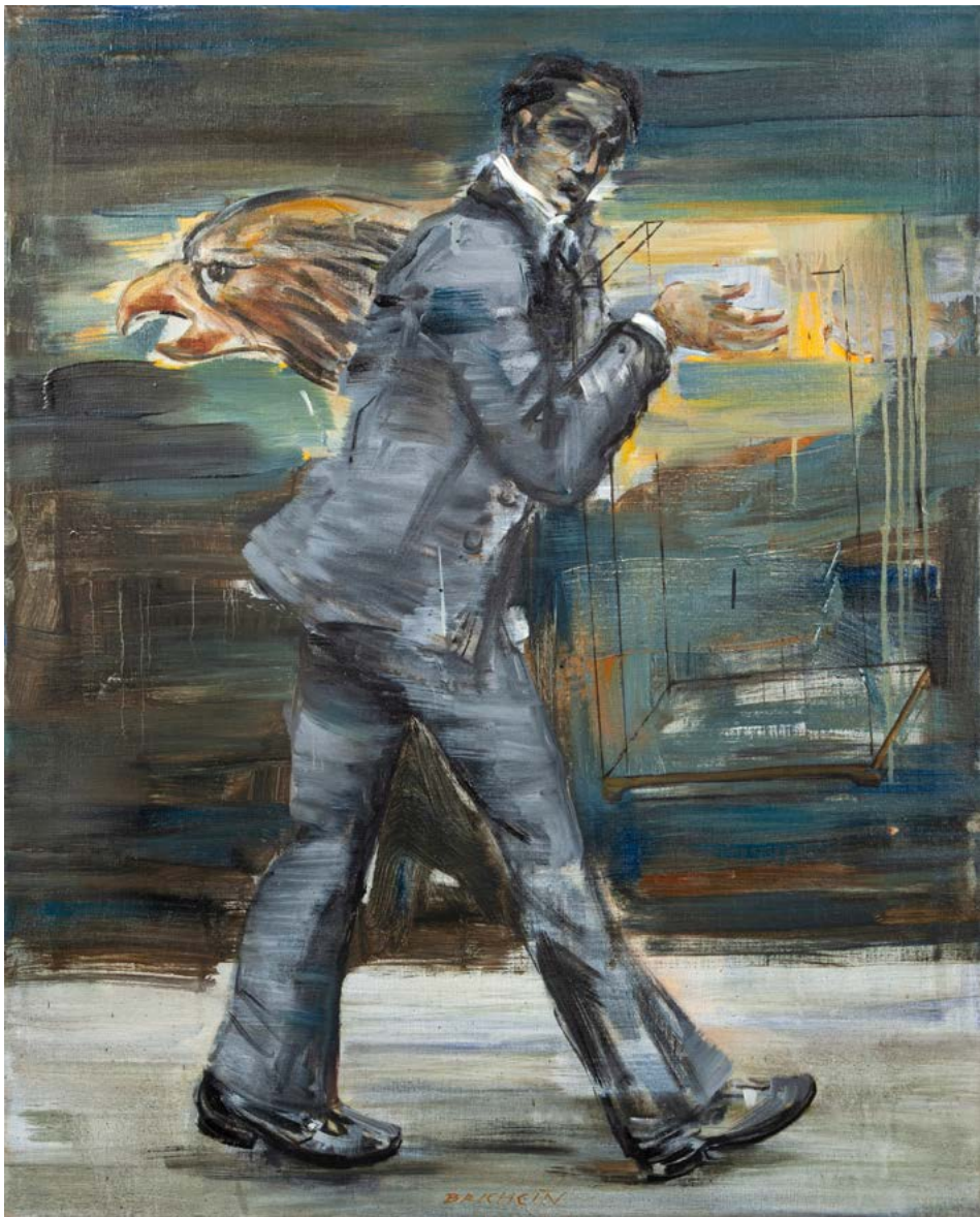
PRÁZDNÁ KLEC / 2021 olej/plátno, 100 x 80 cm