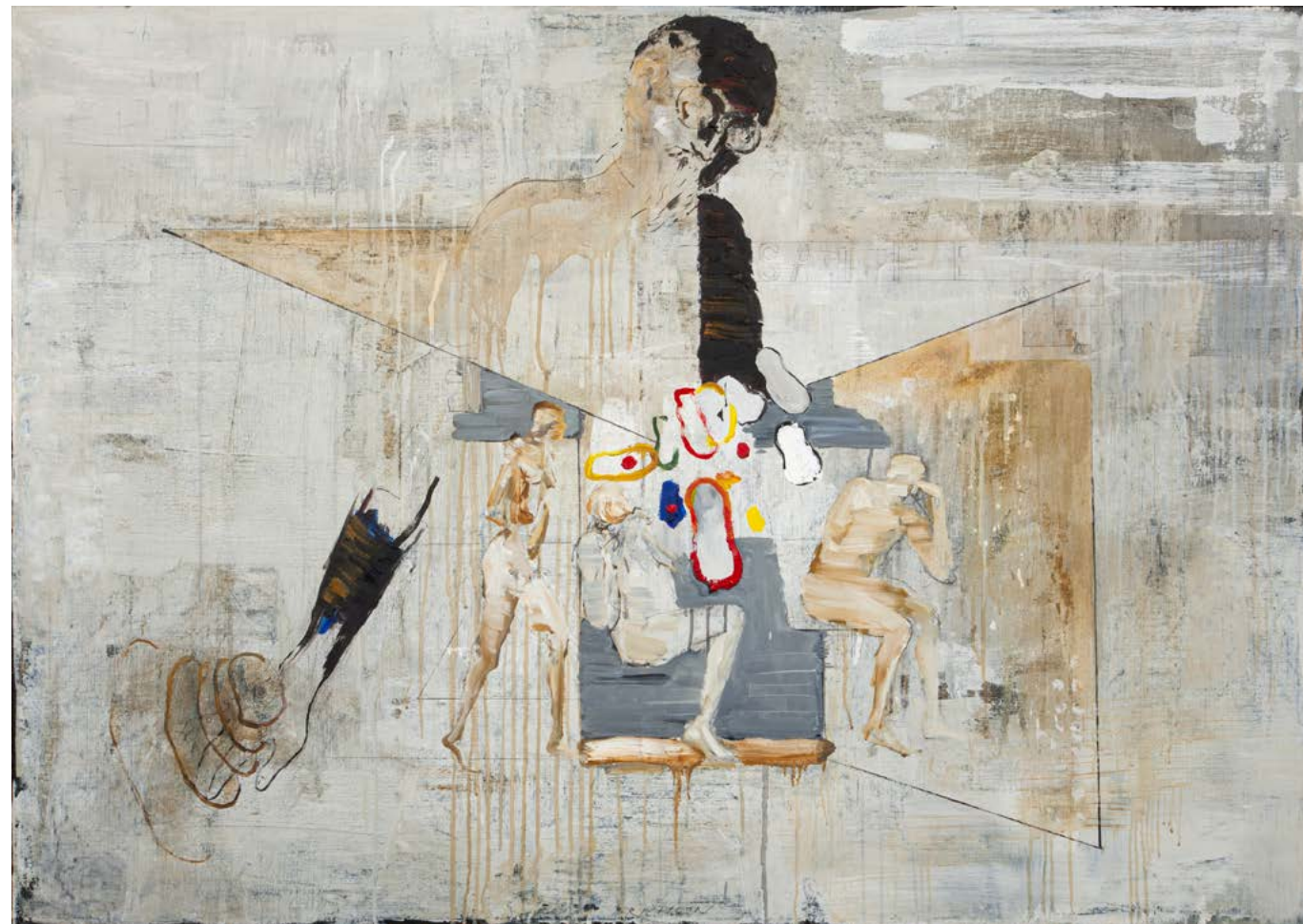
HOMMAGE Á ERIK SATIE / 2020 olej/plátno, 100 x 140 cm