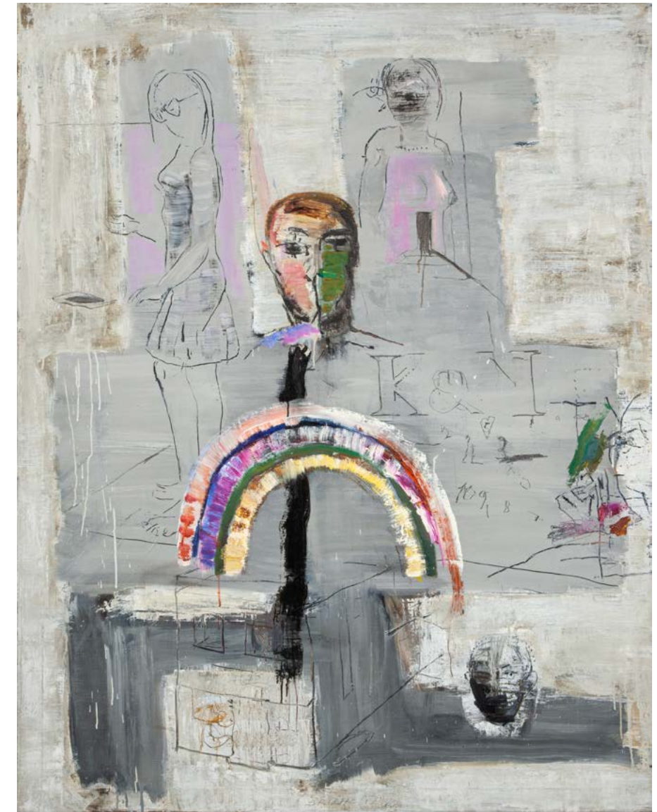
SESTRY / 2022-23 olej/plátno, 130 x 100 cm