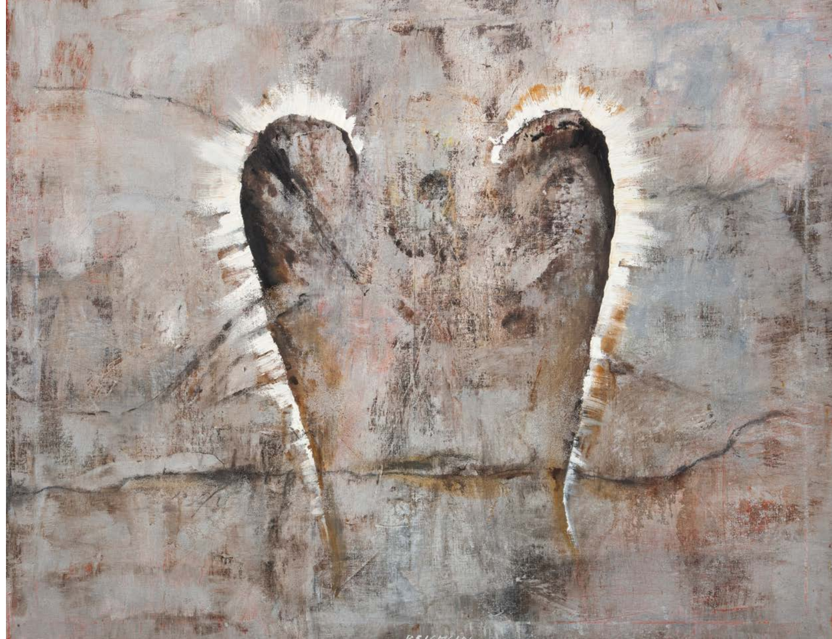
KRAJINA S BÍLÝMI KŘÍDLY / 2023 ▶ olej/plátno, 85 x 105 cm