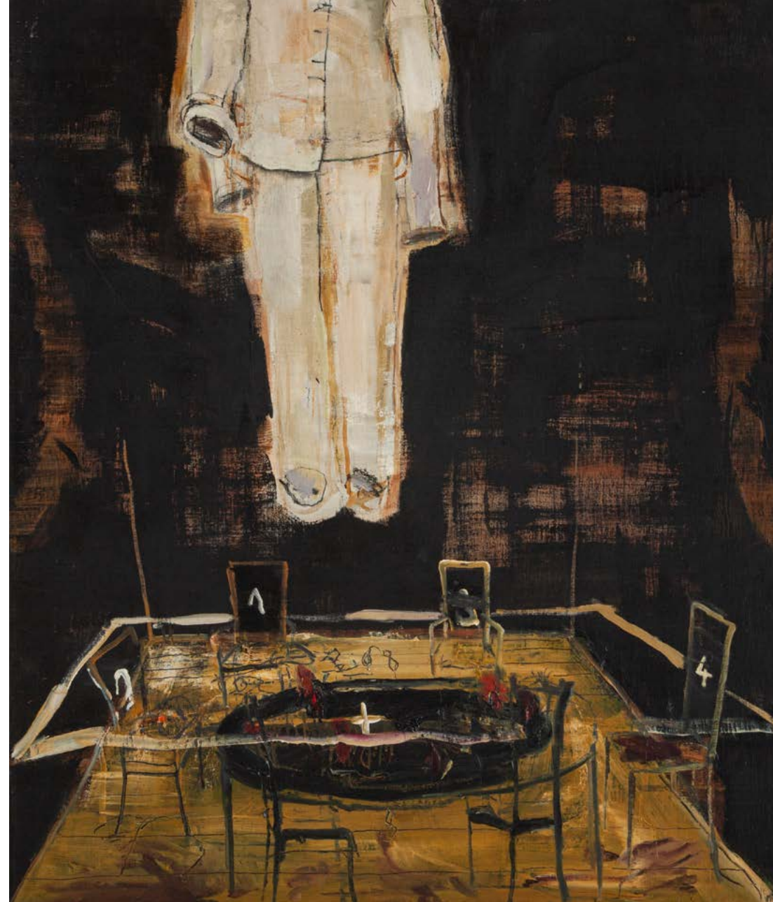
VEČER V ATELIÉRU / 2010 olej/plátno, 130 x 110 cm