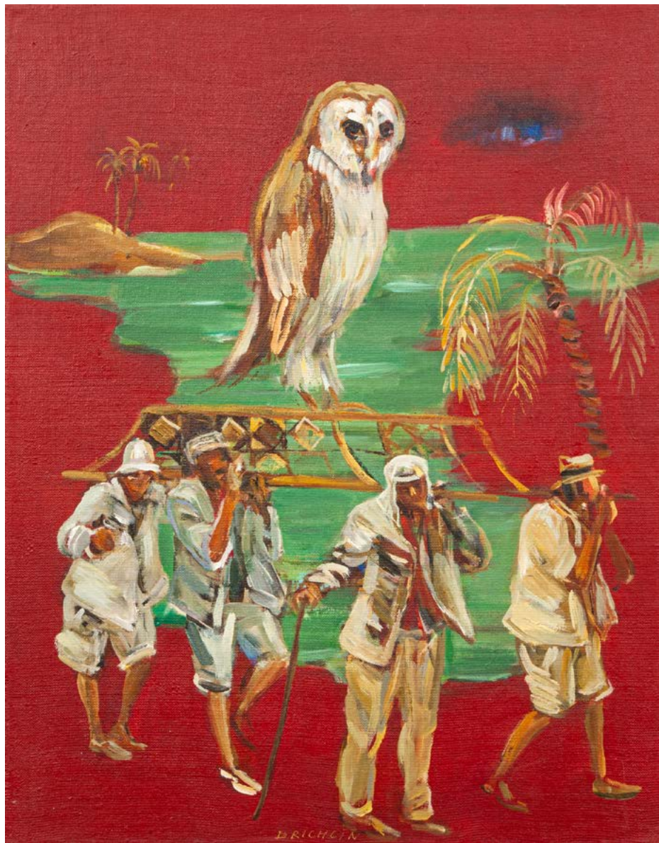
EXPEDICE / 2020 olej/plátno, 65 x 50 cm