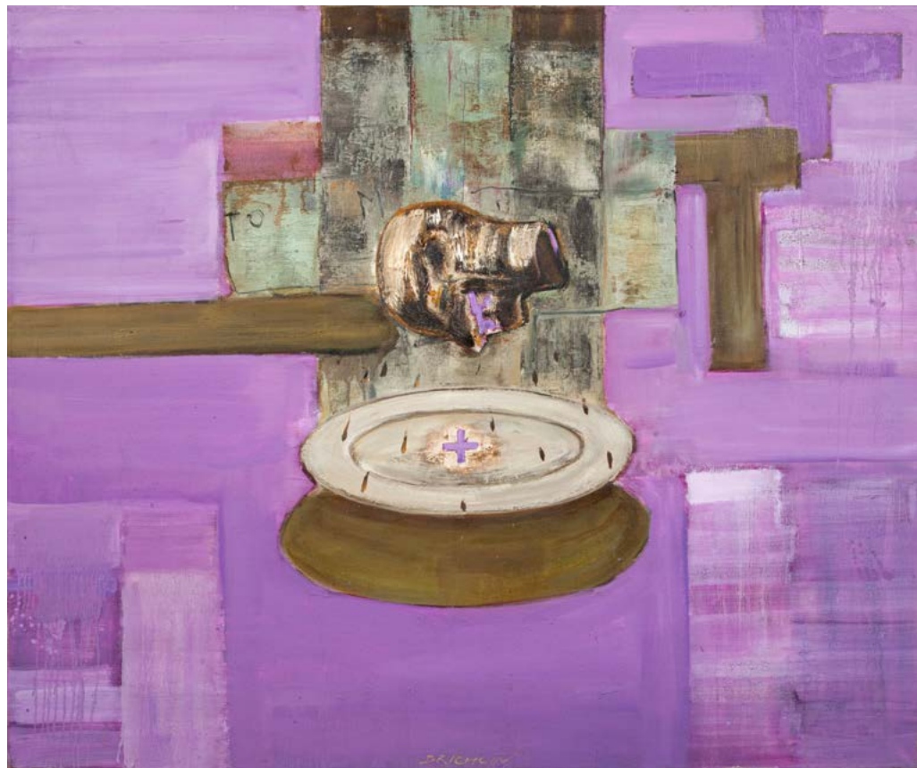
POSTNÍ OBRAZ / 2022-24 olej/plátno, 105 x 125 cm