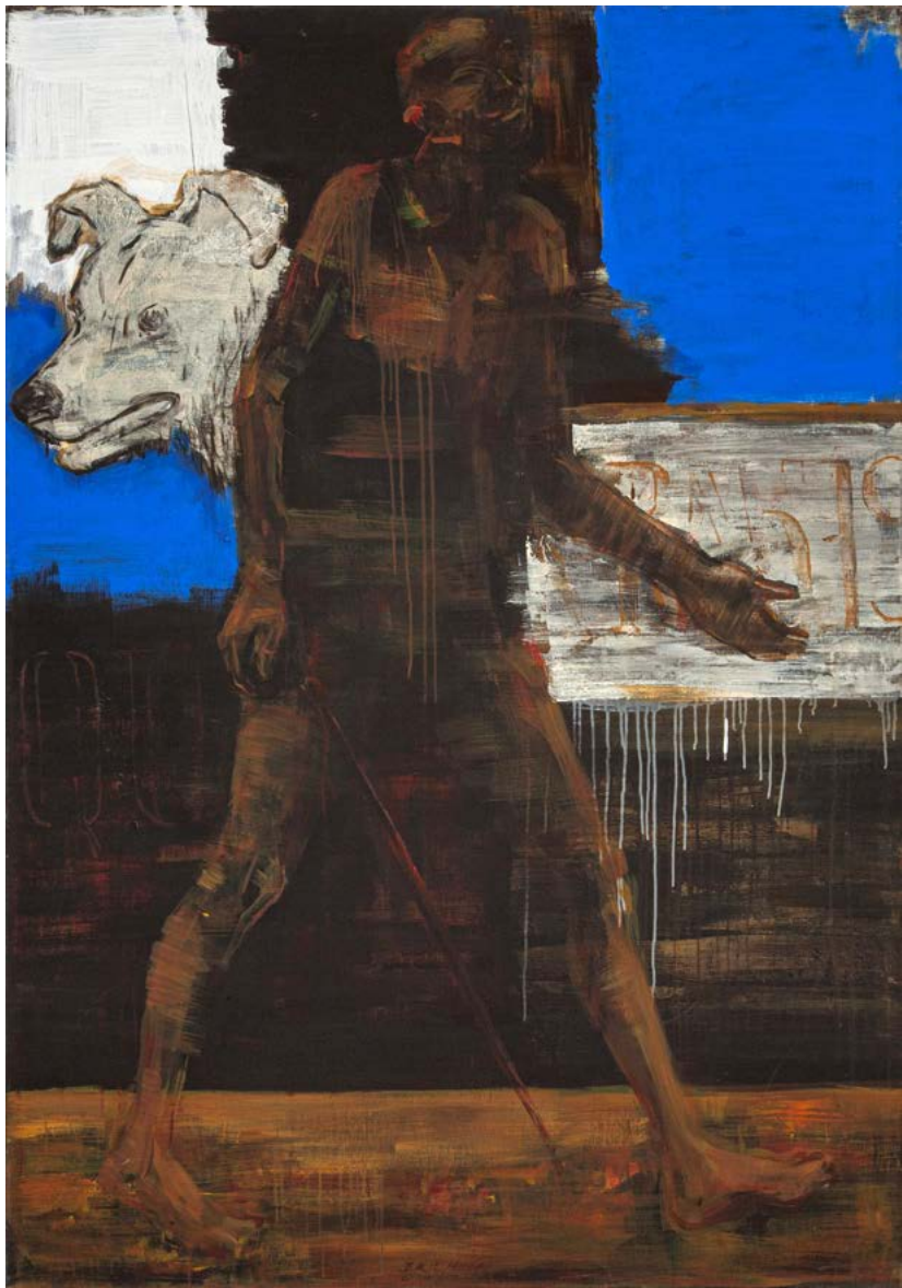
ARABESKA II / 2021 akryl,olej/plátno, 180 x 125 cm