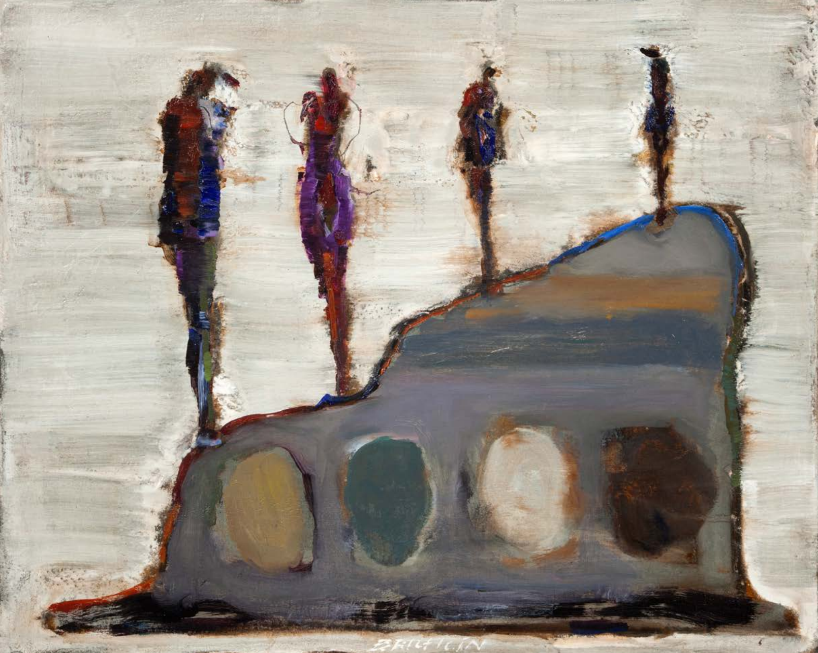
KVARTET / 2023 olej/plátno, 50 x 60 cm