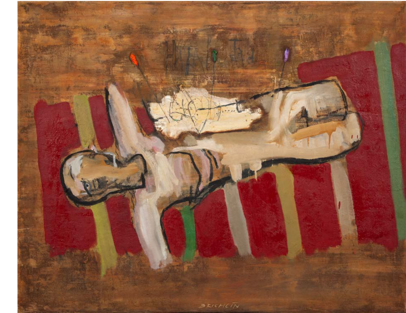
◀ POZOROVATELNA / 2021 olej/plátno, 85 x 105 cm