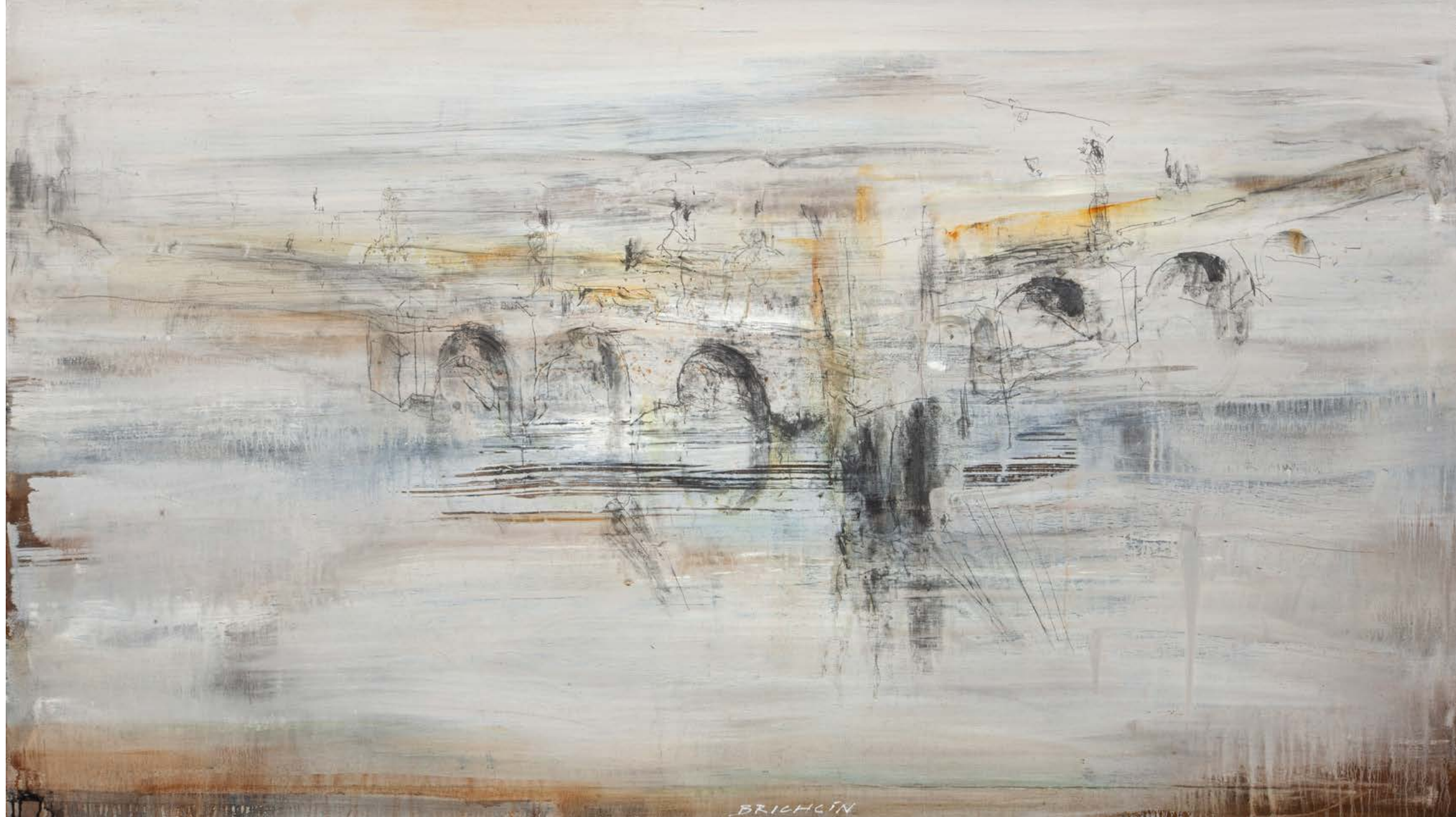
MOST / 2022-23 olej, grafit/plátno, 80 x 140 cm