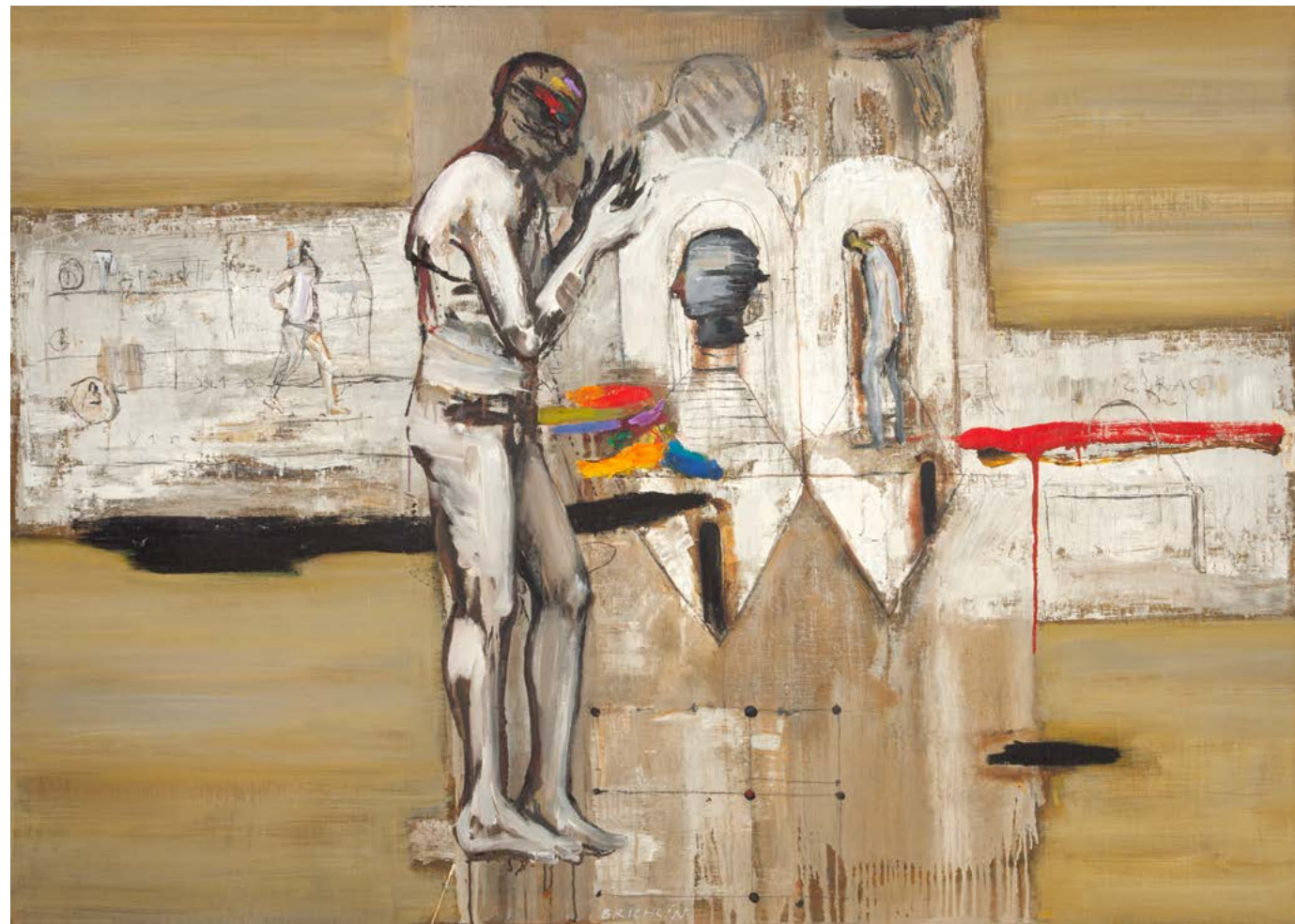
OZVĚNY / 2014-23 olej/plátno, 100 x 140 cm