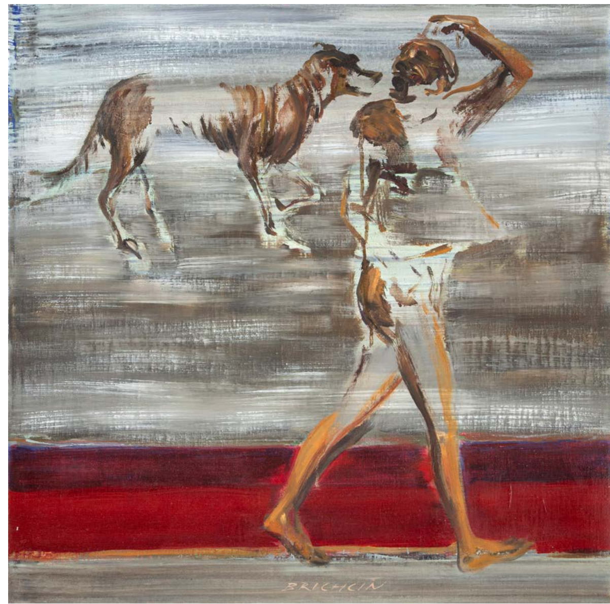
NA ÚROVNI / 2023 olej/plátno, 65 x 65 cm