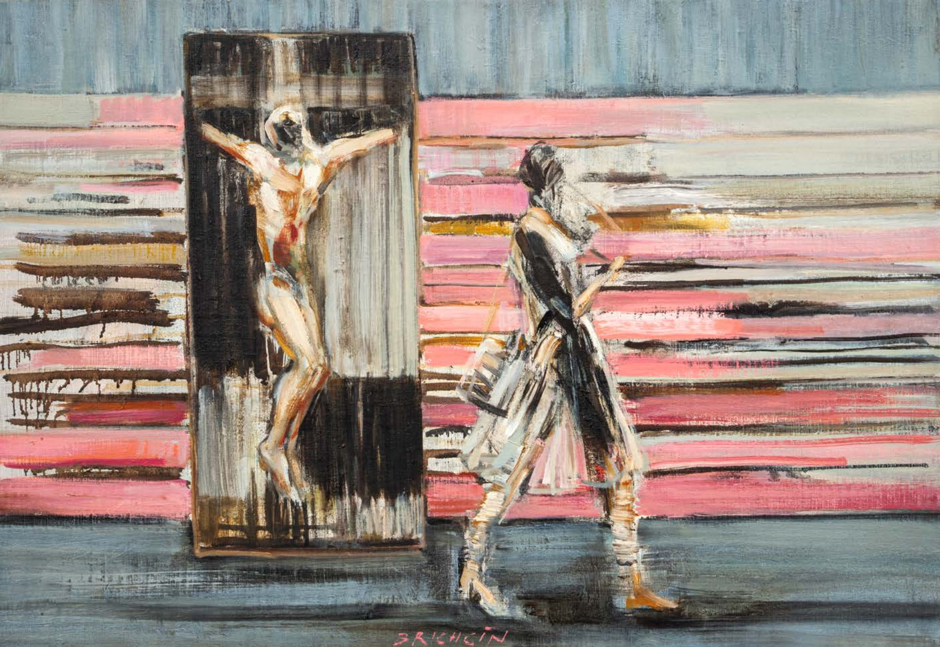
PUNTA DELLA DOGANA I (OKAMŽIK) / 2023 olej/plátno, 50 x 70 cm