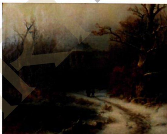
Zasněžená krajina, ZČG Plzeň

Námět zimní krajiny s kostelem zpracoval Piepenhagen poprvé ve svých vzornících ( Zimní krajina s gotickým kostelem , olej, papír, 9,7 x 12 cm, 40.–50. léta 19. století, Národní galerie v Praze, inv. č. O 864, pasparta č. 31). Byly to malé, pečlivě propracované olejové kompozice a umělec je sám řadil do tematických sérií a adjustoval do jednotných paspart – vzorníků . Nebyly však krajinářskými studiemi, ale návrhy budoucích obrazů. Jejich prostřednictvím Piepenhagen nabízel své krajinomalby k prodeji; objednavatel si mohl vybrat ze vzorníků motiv podle svého vkusu a zvolit i velikost budoucího obrazu. Námět zimní krajiny s kostelem malíř poté zpracoval přinejmenším ve dvou obrazových variantách: v menší Zasněžené krajině (olej, plátno, 33 x 43 cm, 50. léta 19. století, Západočeská galerie v Plzni, inv. č. O 1351) a v předložené práci.