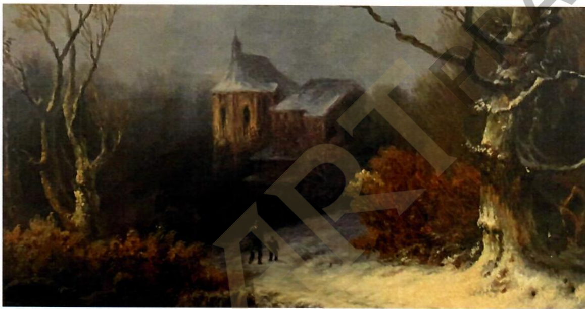
detail z předložené práce