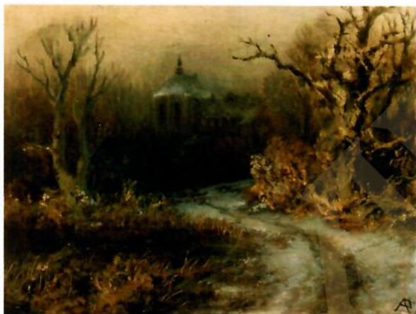
Zasněžená krajina s kostelem, vzorník, NG v Praze

Od čtyřicátých let 19. století se v Piepenhagenově tvorbě objevovaly zimní náměty. Některé z nich byly ovlivněny pracemi holandských mistrů 17. století, které byly šířeny v grafických reprodukcích, jiné plátny německých romantických umělců. Tato díla inspirovala malíře k řadě náladových studií i k větším reprezentativním obrazům, v nichž téma s obrovskou invencí varioval: někdy zachycoval bruslaře na zamrzlých rybnících, jindy intimně laděné scenérie zasněžených říčních či rybníčních krajin se staveními, hrady či kostely, jak můžeme vidět i na předloženém plátně. Nejdůležitější roli však vždy hrála nálada přírody, rozptýlené zimní světlo a atmosféra mrazivého dne.